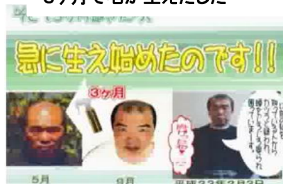
3ヶ月で毛が生えだした