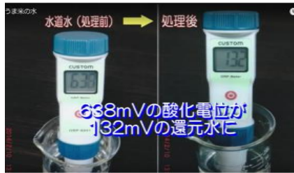
水道水が還元水になります