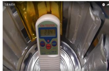
うま米容器内部のーイオン