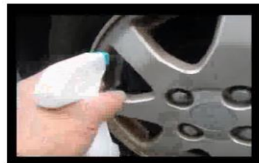
還元水だけで汚れが落ちた