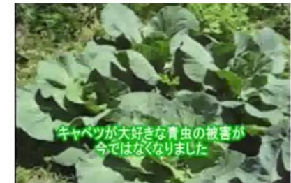
青虫の被害が少ない