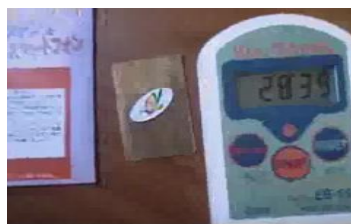
電磁波ガードから生じるーイオン