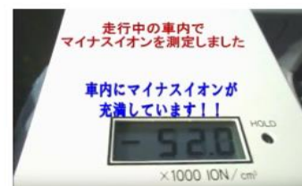
車内がーイオンで充満