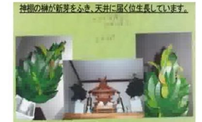
棚の棚に芽がふきます