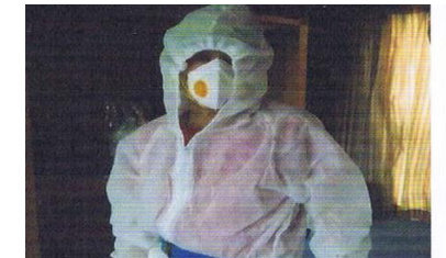
ーイオンでPM2.5を防御