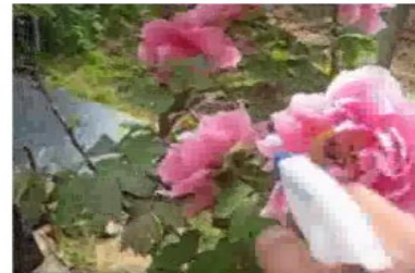
花が生きいきとします