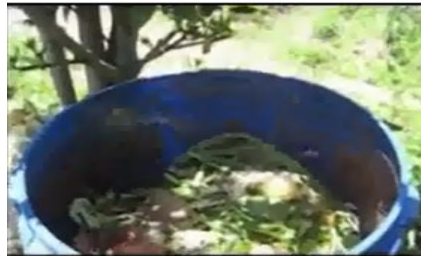
生ごみのウジ虫発生がない