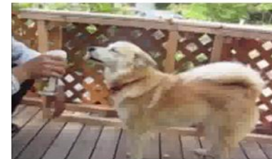
犬の匂いが消え毛並みも良くなった